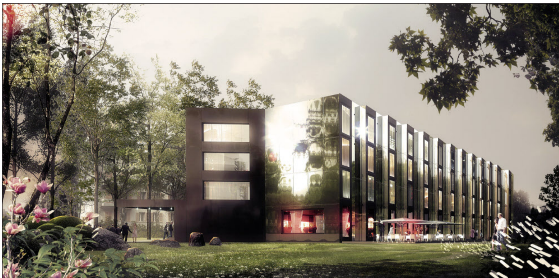
Die Fassade des soeben eröffneten City-Garden-Hotels in Zug: In ihrem Chrom spiegelt sich die Umgebung.